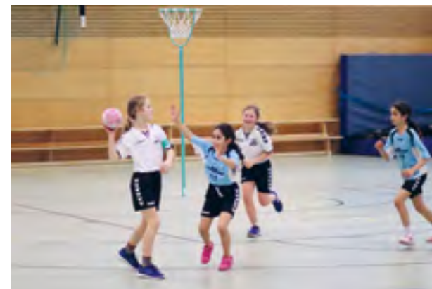
Das Duell zwischen unserer 1. und 2. Mannschaft in der Altersklasse 10/11

Gute Aussichten für eine Teilnahme an der Landesmeisterschaft hat auch