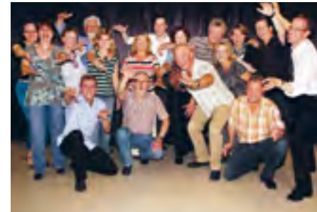
Die Tanzgruppe 2012