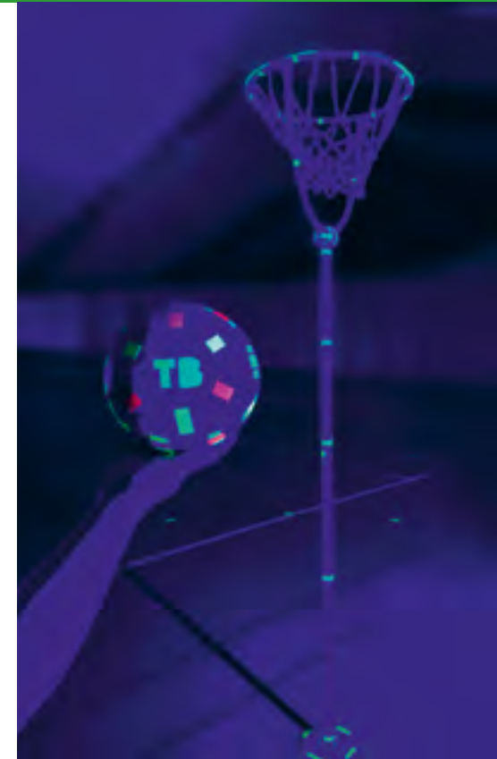
Ebenfalls mit leuchtenden Farben präpariert: Ball & Korb

...und es ging, nach einigem Herantasten an die Sichtverhältnisse, besser als gedacht. Es wurden Spielzüge gezeigt, Konter gelaufen, Weitwürfe getroffen und diverse Bälle von den Korbhüterinnen abgewehrt. Kurz gesagt: Alle hatten sehr viel Spaß.