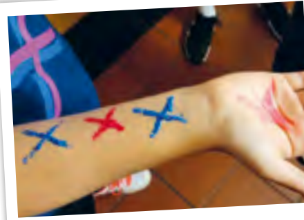
Hautnah: Team „X“ malt sich die Zeichen mit Neonfarbe auf

Drei Teams wurden gebildet und mit Farben und Kennzeichen versehen. Es gab die Dreiecke, die Rechtecke und „X“-e. Die Aktiven wurden entsprechend mit den Zeichen ausgestattet und schon dabei hatten alle viel Spaß. Shirts, Gesichter, Arme und Beine mussten für die entsprechende Bemalung erhalten. Dann konnte es losgehen!