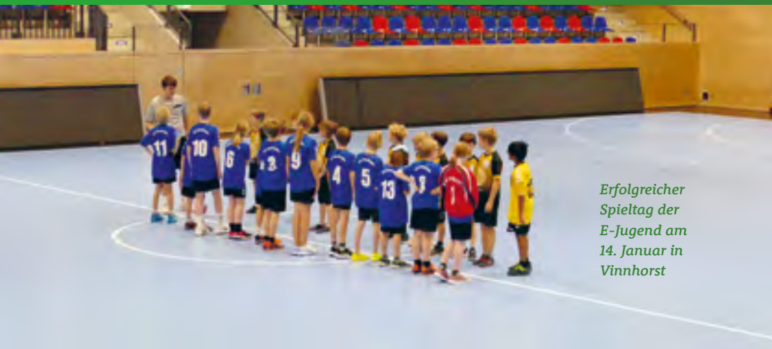
Erfolgreicher Spieltag der E-Jugend am 14. Januar in Vinnhorst