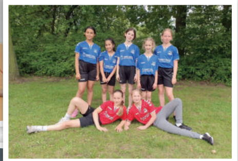
Unsere Jugendteams bei den Hallen- und Feldturnieren im Sommer